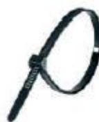
Abraçadeira plástica (x4)