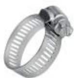
Abraçadeira metálica (x2)